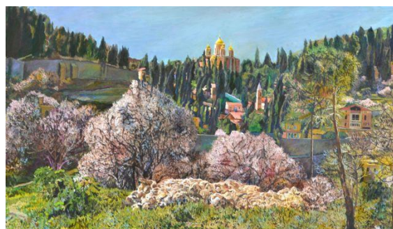
דוד הראל עין כרם.