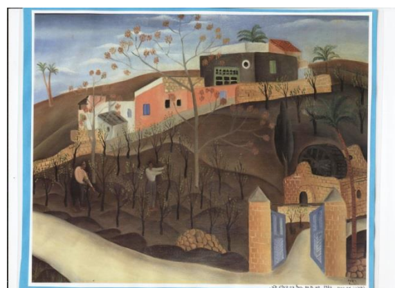
ראובן רובין עין כרם